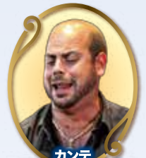
カンテ MOI DE MORÓN モイ・デ・モロン